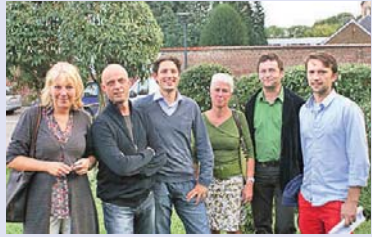
De organisatie van Jazz Hoeilaart.