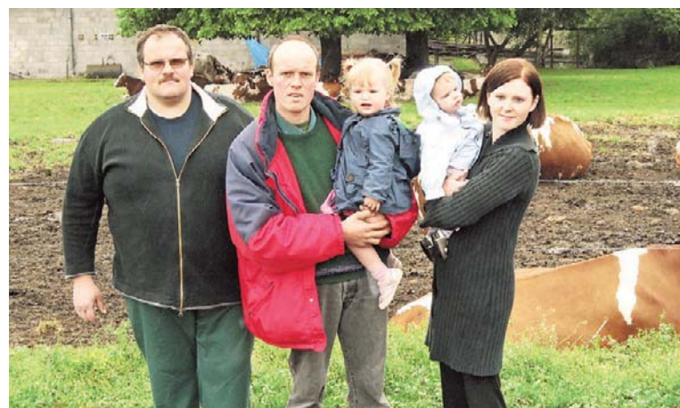
De broers Dumortier runnen het bedrijf met hun tweeën.

ZOUTLEEUW - Landbouwmarkt Zoutleeuw, Leeuwerweg - Ambachten vroeger en nu